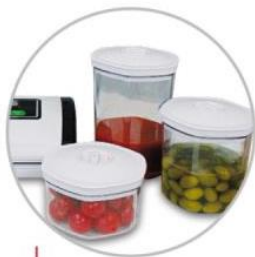
Contenitori sottovuoto Vacuum containers