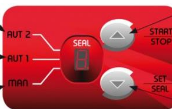
Inizio Vuoto Vacuum start