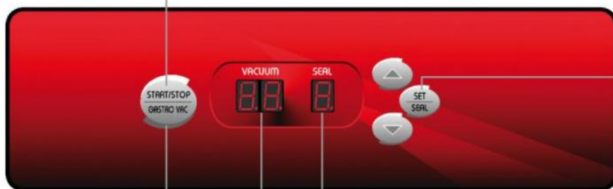
Accensione / Spegnimento confezionatrice Switch on / switch off of the vacuum packaging machine