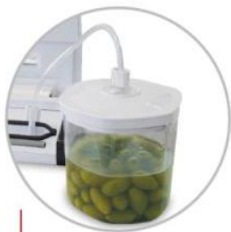
Tubo per connessione contenitori Connection tube for containers